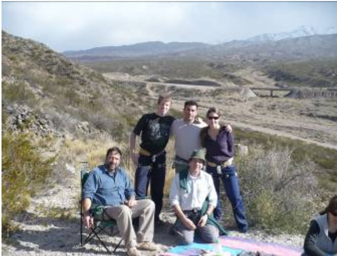
La plana mayor del GEMA luego de una agotadora sesión de fierros (cuchillo y tenedor).

¡Las aguas termales siempre a la mano!!!