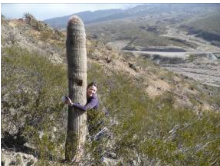
Los sueños de Gaby, al fin, se cumplen!!!