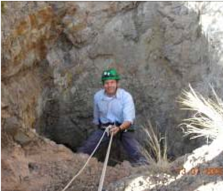
El comandante Castro: se dedicaría a la construcción en altura (por si la ingeniería electrónica no da, vió?).