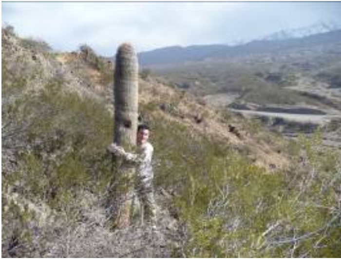
Los de Nico TAMBIÉN!!!!

El domingo 3 de agosto de 2008 se realizan nuevas actividades, practicando más anclajes, alrededor del chiflón.